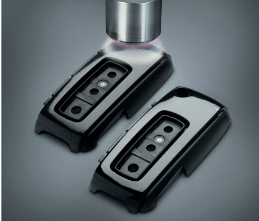
Resim 4: Plasmatreteat © Soldaki parça PA anahtarı alt parçasının Openair plazma ile ön işlemini göstermektedir. Sağdaki parça aynı parçanın şeffaf, çizilmeye karşı dayanıklı kaplamanın uygulanmasından sonraki halini göstermektedir.

Plasmatreteat AR-GE Bölümü Başkanı Dr. Alexander Knosp kimyasal prosesi bu şekilde açıklıyor: "Plazma ön işlem