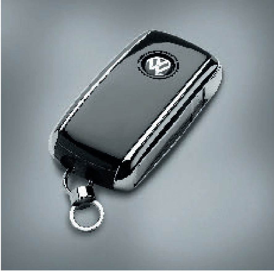
Resim 2: Plasmateat © Mükemmel boya görünümü: Bitmiş tasarım anahtar koyu siyah renk, yüksek parlaklıkta optik efekte sahip.

yapıştırmaya son derece dirençli yüzeyler üzerinde bile su bazlı yapıştırma veya boyama mümkün hale gelmiştir.