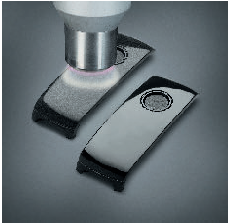
Resim 1: Homojen boya katmanı ve boyanın güçlü, uzun ömürlü, dengeli yapışmasını sağlamak için tasarım anahtarların poliamid kılıfları atmosferik plazma ile ön işlemden geçirildi.

Bir kaplamanın sağlam şekilde yapışması katı malzemenin yüzey enerjisinin sıvı yapıştırıcı veya boyanın yüzey geriliminden ( \text{mN}/\text{m} ) daha büyük ol-